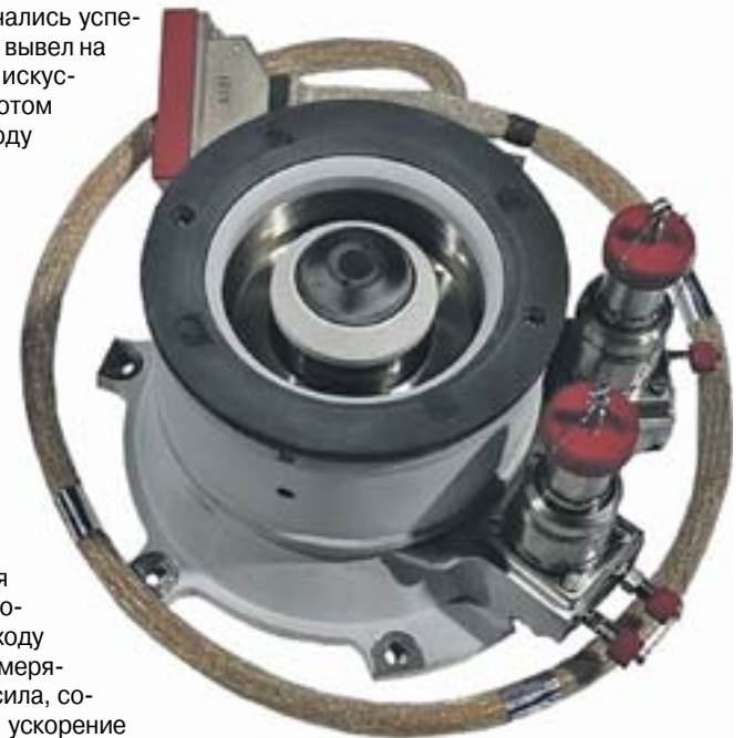
Двигатель KM-75 разработки АО ГНЦ «Центр Келдыша».

Но вернемся к ионному двигателю. В нем происходит ионизация газа (или другого рабочего тела). Электрическим полем ионы разгоняются до громадных скоростей - 210 км/с. Они-то и двигают ракету. Для сравнения: у химических ракетных двигателей скорость реактивной струи составляет 3 - 4,5 км/с. Характеристикой ракетного двигателя является удельный импульс - это отношение тяги двигателя к расходу топлива. Тяга двигателя измеряется в ньютонах (1 ньютон - сила, сообщаемая телу массой 1 кг ускорение 1 м/с 2 в направлении действия силы). Расход же измеряется в кг/с. В результате получаем, что удельный импульс измеряется, как и скорость, в метрах в секунду (м/с) или