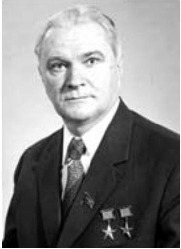
Валентин Петрович ГЛУШКО

Сконструированный Валентином Петровичем в ГДЛ ионный двигатель показал превосходные характеристики. Однако он годился для безвоздушного пространства, в невесомости. Но поднять ракету с Земли такой двигатель не мог. Стало ясно, что идея ионного двигателя опережала технические возможности того времени, и Глушко в начале 1930 года перешел к созданию химических ракетных двигателей.