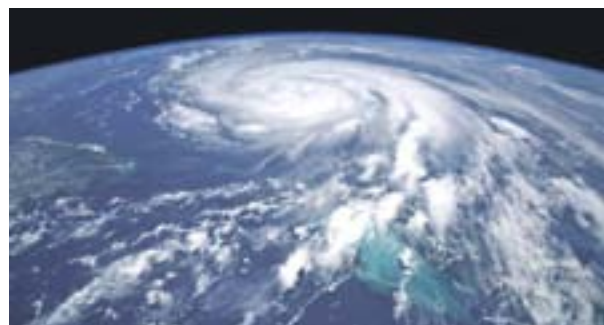
Фото космонавта Роскосмоса Олега Новицкого

в километрах в секунду (км/с). Потребляемая мощность типового ионного двигателя 1 - 7 кВт, скорость истечения ионов 20 - 50 км/с, коэффициент полезного действия 60 - 80 %, время непрерывной работы - более трех лет, а тяга всего лишь 0,020 - 0,250 Н. Как читатель уже догадался, главный недостаток современного ионного двигателя - очень слабая тяга или мощность. Для сравнения: тяга двигателя ракеты Р-7, выведшей на орбиту первый искусственный спутник Земли, - 71 000 кг (приблизительно 710 000 Н).