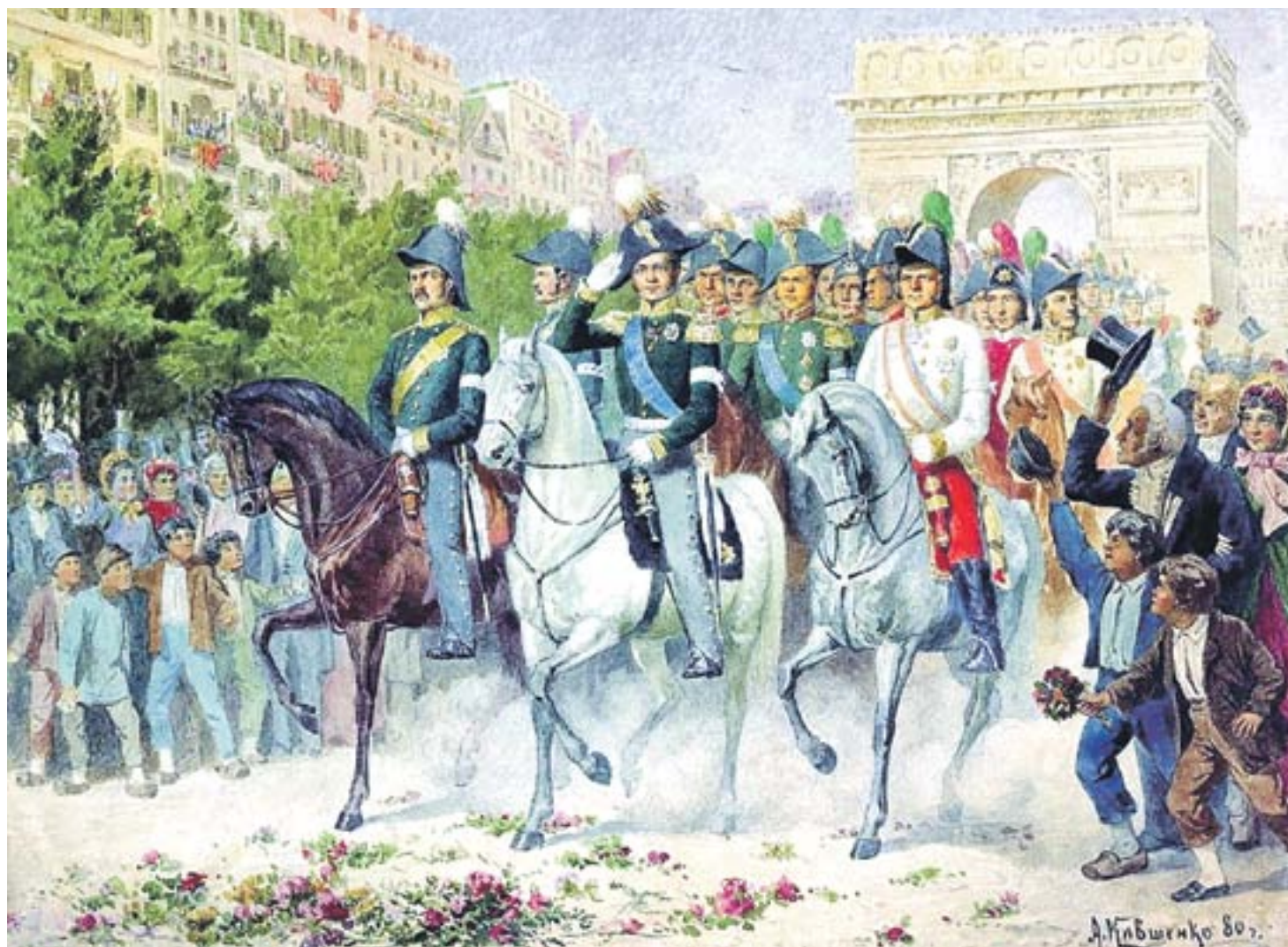
Алексей Кившенко 1880 г. «Вступление русских войск в Париж в 1814 году»

ВСЕ ОБ ИСТОРИИ СТРАНЫ УЗНАЕШЬ В ГАЗЕТЕ «ВЕСТИ ДОСААФ»!