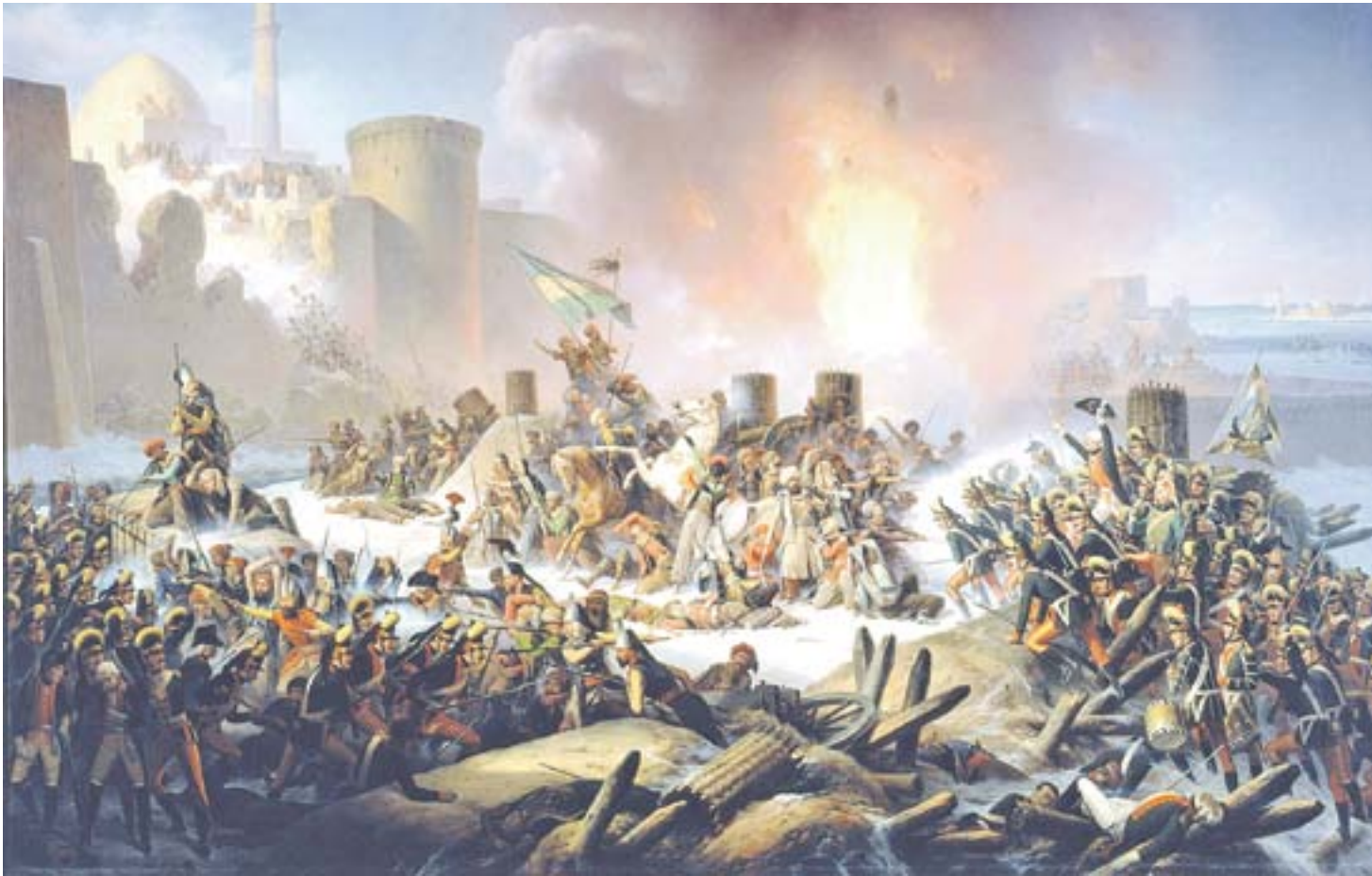
Штурм Очакова 6 декабря 1788 г. Я. Суходольский. 1853 г.

зволили начать осаду Очакова с суши, которая продолжалась пять месяцев - с июля и до начала декабря 1788 г.