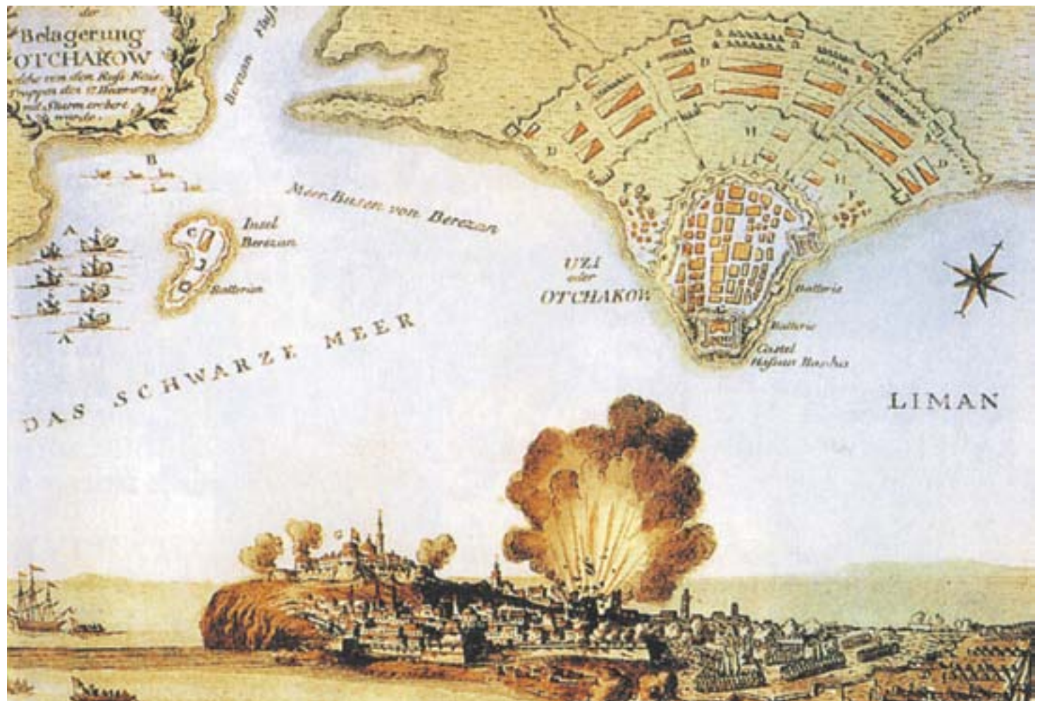
План турецкой крепости Очаков, взятой русскими войсками 6 декабря 1788 г. 1790-е гг. Раскрашенная гравюра. Австрия

На подступах к крепости находилась первая линия защитных укреплений - нагорный ретраншемент (франц. окоп; большое полевое укрепление. - Авт.), включавший в себя ров и вал, - которая представляла собой самостоятельный укрепленный лагерь. На валах и крепостной стене стояло около 300 пушек, а в ретраншементе - около