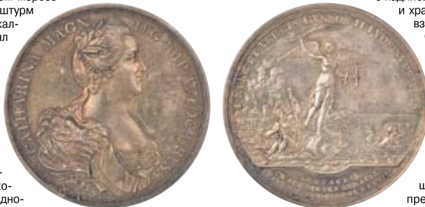
Серебряная медаль, отчеканенная в Амстердаме в честь взятия Очакова.

Материал подготовлен Научно-исследовательским институтом (военной истории) Военной академии Генерального штаба ВС РФ. Источник: encyclopedia.mil.ru