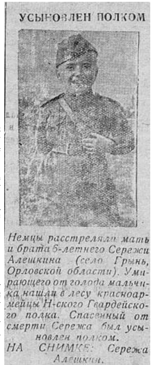
Ссылка на оригинал документа: https://cloud.mail.ru/public/1q9j/dfhazht1 Ссылка на материал проекта: https://pamyat.mil.ru

Публикация рассекреченных документов из фондов Центрального архива Минобороны России о работе фронтовых писателей направлена на противодействие фальсификации истории и сохранение исторической памяти о Великой Отечественной войне.